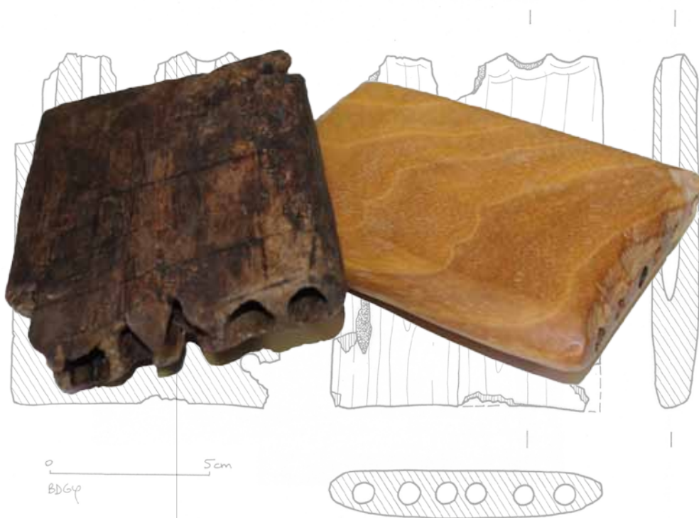
Frestel, XIe siècle, Charavines-Colletière